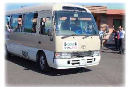
関係者に見送られ、出発!!