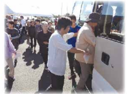
バスに乗車する利用者の皆様