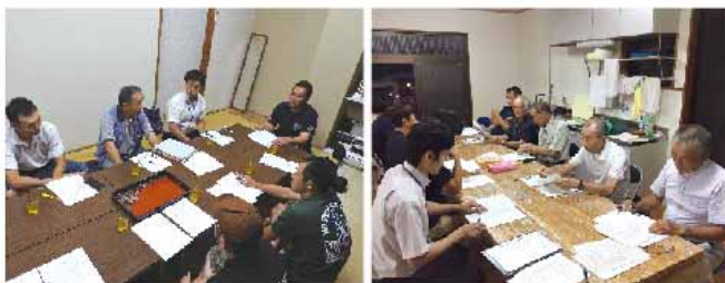
海道町・小薄町地域福祉協議会の話し合いの様子