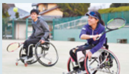
障がい者スポーツの経費として