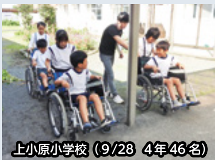
上小原小学校(9/28 4年46名)