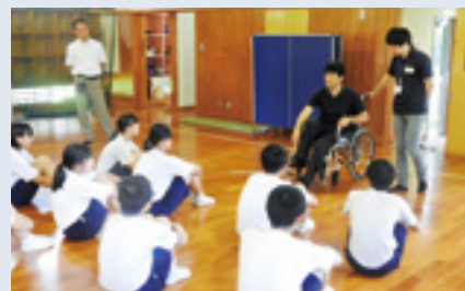
高隈中学校(7/11 2・3年生26名)