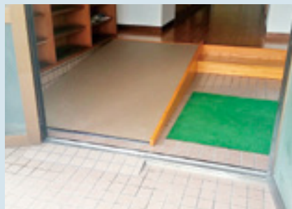
公民館のスロープ設置費用として