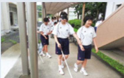
吾平中学校(7/10 3年生59名)