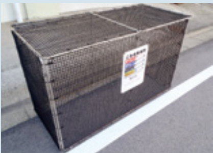
ゴミステーションの設置費用として