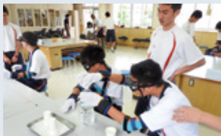
鹿屋工業高校(7/6 3年生94名)