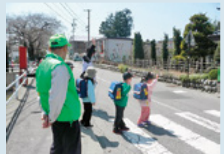
見守り活動の経費として