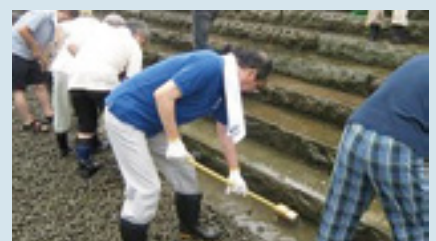
海岸清掃の経費として