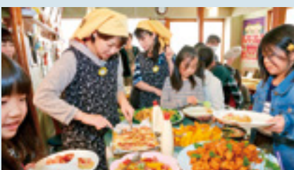
子ども食堂の経費として