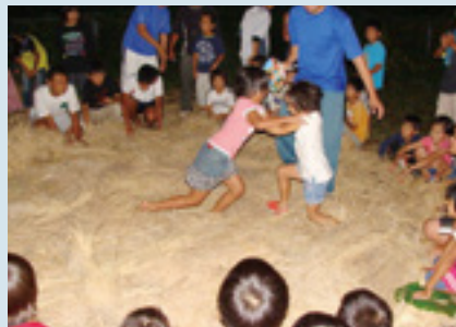
地域交流の経費として