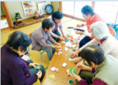
ふれあい・いきいきサロンの経費として