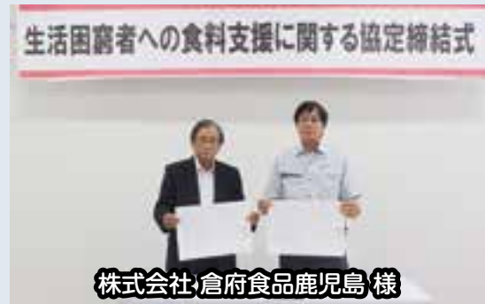
株式会社倉府食品鹿児島様

一時的に生活に困窮し食べる物に困っている世帯に対し、支援を行う「生活困窮者への食料支援に関する協定」を、当会と2つの企業・団体との間で締結いたしました。