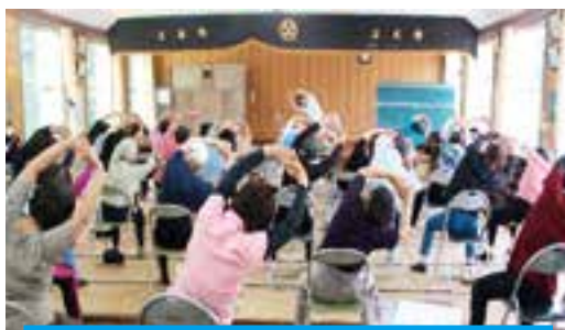
自分の健康は自分で!!