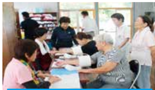
運動前の血圧測定もお互いに!