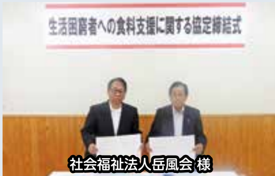
社会福祉法人岳風会様