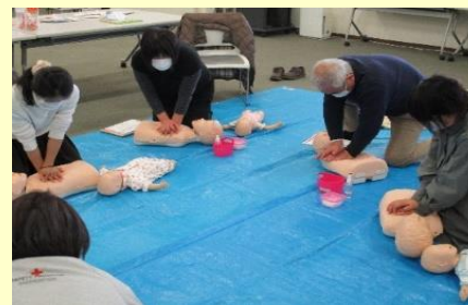
「幼児期に起こりやすい事故とその予防及び手当」について

第1回講習会 R3.6.11(金) 第2回講習会 R3.10.28(木) 第3回講習会 R4.2.27(日)