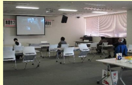
「子育て支援の仕組み」について