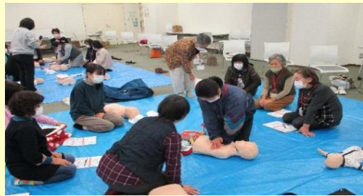
緊急救命の実技をおこないました

※救命講習はサポート・両方会員を対象に、少なくとも5年に1回の受講が義務づけられています。