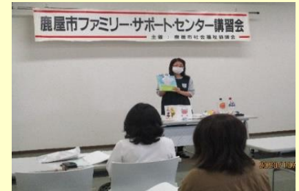
「子どもの発達と遊び方」について