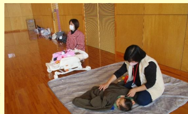
全体交流時の託児の様子