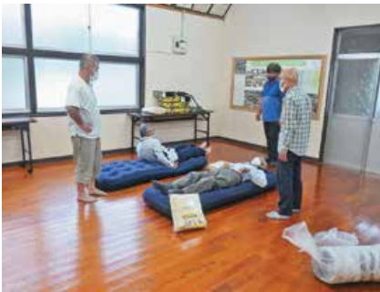
祓川町内会 (避難所用エアベッド等の整備)