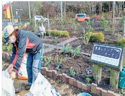
チームガーディニア (環境美化活動の実施)