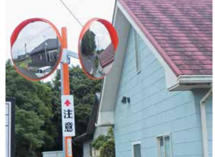
大迫町内会 (ロードミラーの設置)