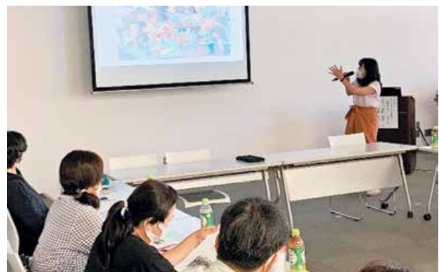
(「たくして」代表からの説明)

7月28日(木)にリナシティかのや情報研修室において、子ども食堂を運営する7か所12名の代表の皆様にご参加いただき、鹿屋市子ども食堂ネットワーク連絡会を開催しました。