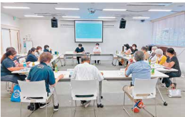
(意見交換会の様子)