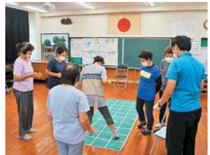
天神町げんきの会 (スクエアステップ運動用マット等の整備)