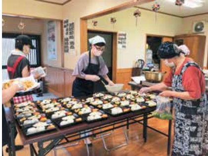
泉ヶ丘町内会 (高齢者等手作り弁当の配付)