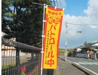
川西町内会 (防犯パトロールのぼり旗の設置)