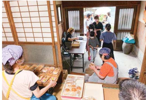
みんなでわいわいこども食堂（寿5丁目）