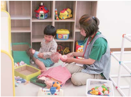
会員の活動（預かり）