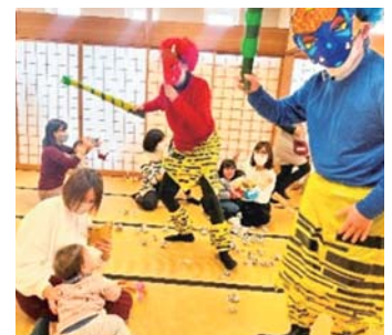
つどいの広場イベント（節分）