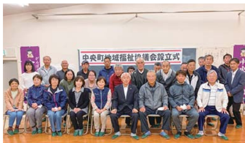
中央町地域福祉協議会（吾平）

町内会等の区域において、住民が主体的に地域課題を把握し、解決するための協議の場として「地域福祉協議会」の設立等を支援しました。