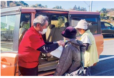
生活支援型ドライブサロン

自ら交通手段を有しない高齢者等に対し、社会福祉法人（社会福祉施設）のマイクロバス等を運行して、生鮮食料品等の買い物支援を行う「生活支援型」と、市内外の名所・観光地への遠足と買い物支援を組み合わせた「生きがいづくり型」の2種類のドライブサロン事業を実施しました。