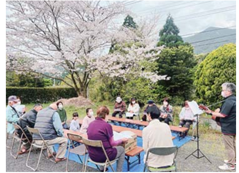
高齢者サロン（吉ヶ別府地区）

今年度から新たに「ボッチャ」が仲間入りしました。地域交流の用具としてぜひご活用ください。