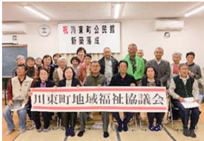
川東町地域福祉協議会 (令和5年5月9日設立)