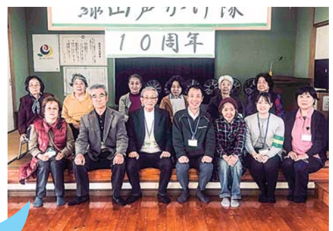
緑山声かけ隊 10周年記念撮影

「緑山声かけ隊」は平成25年3月に結成された見守り隊です。隊員の無理のない範囲で活動を続けています。