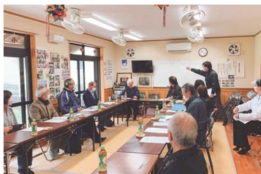
妙円寺自治会（日置市）による泉ヶ丘ふれあい隊の視察

高齢者等が地域で安心して暮らせるように見守る「見守り隊」の設立支援と、それらの活動支援を行いました。