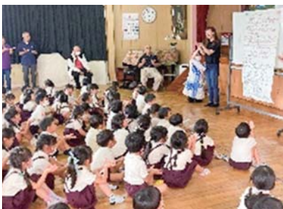
福祉体験出前講座（手話）