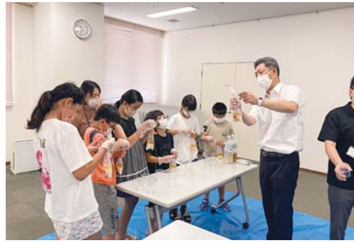
わくわくボランティア体験学習 (小学生)