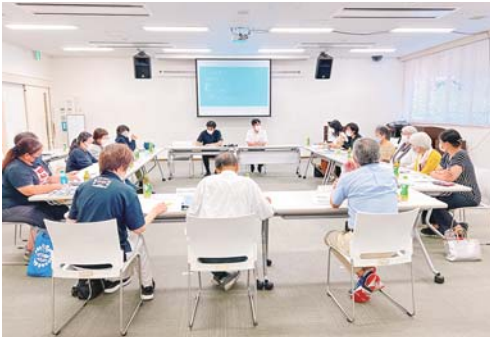
子ども食堂ネットワーク連絡会