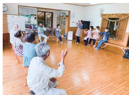
高齢者サロン（小薄町）

住み慣れた地域ごとに気軽に集える場所をつくり、生きがいづくり、仲間づくり等を行っている高齢者サロンの活動と新規サロンの立ち上げを支援しました。