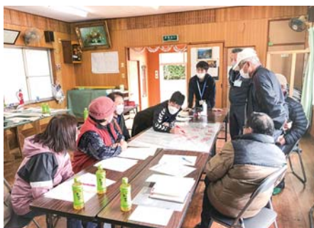
支えあいマップ作成（船間）

支援が必要な方と、関わりのある方を地図上におこし、地域でのつながりを把握するための活動を支援しました。