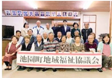
池園町地域福祉協議会 (令和5年5月13日設立)