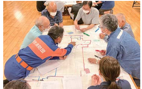
支えあいマップ作り（大堀地区）

支援が必要な方と住民等とのかかわりを住宅地図に落とし込み、課題を抽出する「支えあいマップ作り」や、住民の困りごと等を把握する「福祉アンケート」の実施などを通して、地域での互助活動のきっかけづくりを支援しています。話し合い等を通して、地域の課題について住民のみなさんとともに考え、解決活動に取り組んでいます。