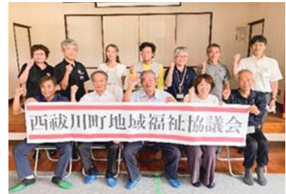
西葦川町地域福祉協議会 (令和5年6月24日設立)