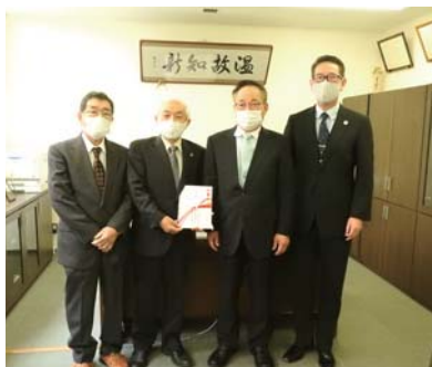
鹿信鹿屋・寿ハッピー会