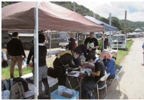
ボランティア受付の様子 (古江地区)