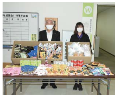
(株)マルハン鹿屋店