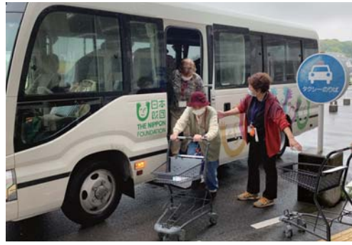
ドライブサロン事業 (高隈地区)

⑤ 高齢者等に買い物や交通手段を提供するとともに、安否確認や生きがいづくりを含む複合的な支援を地域の社会福祉法人と協働で実施しました。