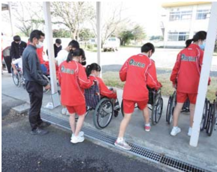
福祉体験出前講座 (大始良中学校)