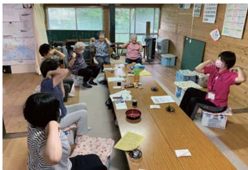
サロン活動の支援 (高須いたっまる会)