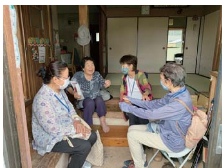
高齢者等見守り隊の活動支援 (上野見守り隊)