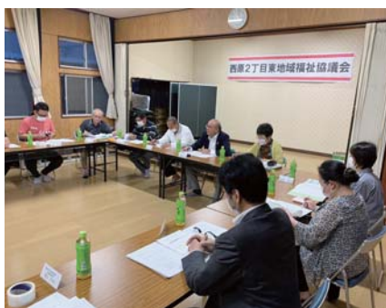
地域福祉協議会定例会の様子 (西原2丁目東町内会)