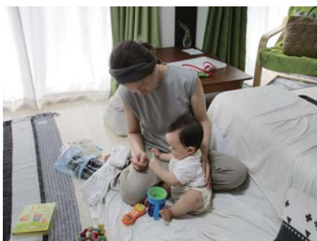
ファミリーサポートセンター事業