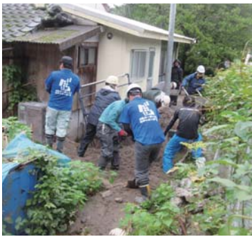
土砂搬出作業の様子 (串良地区)

① 鹿屋市と協働で古江地区にボランティアセンターを設置し、大隅災害復旧ボランティアグループ活動の後方支援を行いました。