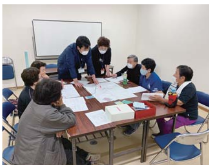
支え合いマップづくり (北田東大手町内会)

② 1つの機関・団体では対応出来ない複雑・複合的な課題がある世帯に対し、高齢・障がい・児童等の分野の機関・団体が協力し、包括的に支援する体制の構築を推進しました。