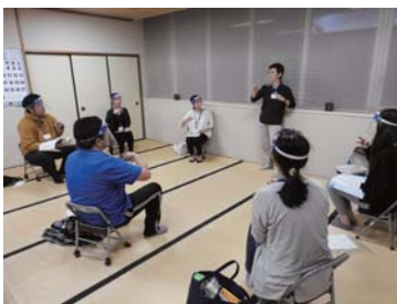
奉仕員養成講習会 (リナシティかのや2F福祉プラザ)