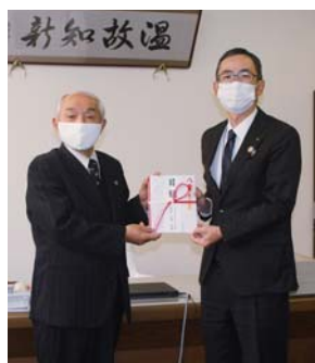
鹿児島相互信用金庫