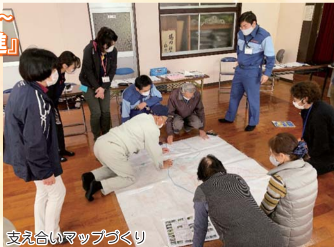
支え合いマップづくり

地域福祉協議会とは、町内会（自治会）などの区域において、地域の問題を「他人事」ではなく「我が事」としてとらえ、その問題を住民同士で互いに支え合って解決に結び付けるための、自主的な地域福祉活動について協議検討する場です。地域の問題を把握するためには、住宅地図を拡大して、そのなかに住民相互の関わり合いや地域の社会資源を書き込む「支え合いマップ」も有効です。