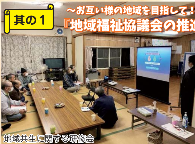
地域共生に関する研修会