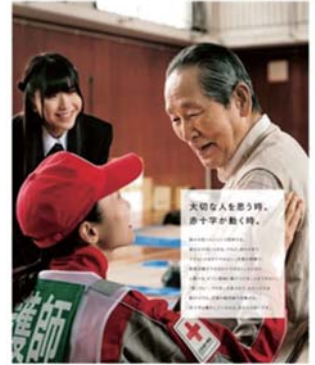
救いを託されている。➡

日本赤十字社は、「苦しんでいる人を救いたい」という理念のもと、災害時に被災された方々に対しての医療救護やこころのケア、救援物資配分などの様々な人道支援活動を行っています。赤十字の活動を支えているのは、皆様から寄せられる活動資金です。皆様のご協力をよろしくお願いいたします。