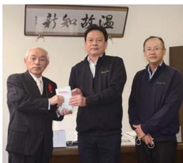
社会福祉法人 以和貴会