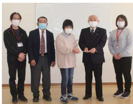
障害者支援施設 ゆらり