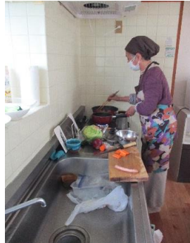
【産前産後の家事支援】